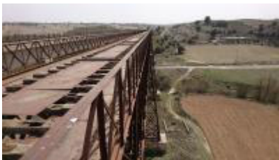
El puente del Hacho, vestigio de Eiffel en Granada