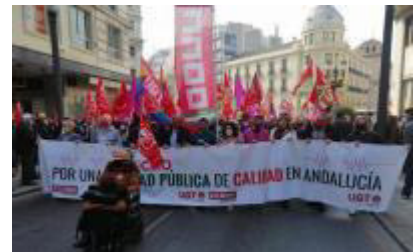
En defensa de la sanidad pública