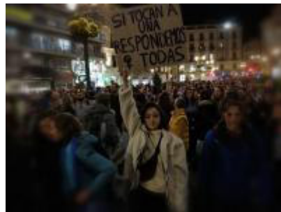
Las imágenes del 8M: La lucha sigue con fuerza